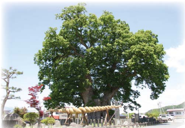
国指定特別天然記念物「大ケヤキ」