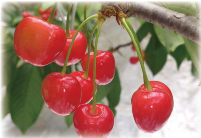
地理的表示(G1)保護制度「東根さくらんぼ」