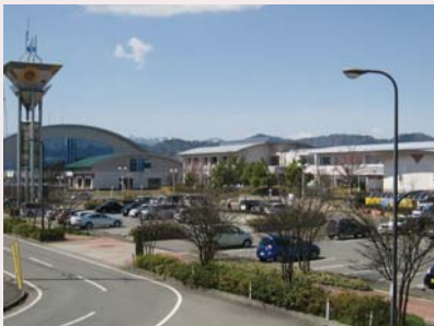
ひまわり温泉「ゆ・ら・ら」